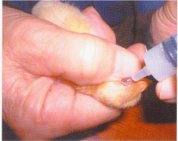
ຢອດດັງ ແລະ ຕາເບື້ອງລະຢອດ