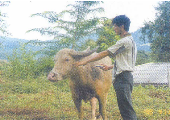
ສັກກ້າມຊີ້ນກີກຂາ ແລະ ຄໍ