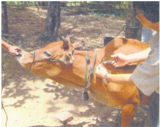
(ສັກກ້າມຊີ້ນກີກຂາ ແລະ ຄໍ)