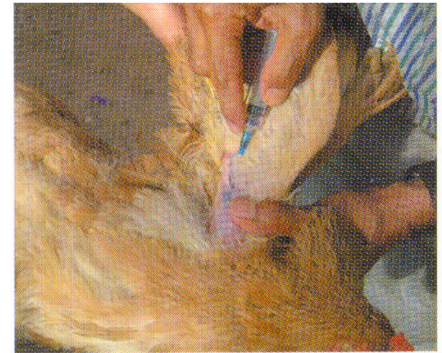
ໃຊ້ເຂັ້ມແທງລົງຝິນປີກ 2—3 ຄັ້ງ

— ບໍ່ຄວນໃຊ້ເຫຼົ້າ ຫຼື ຢາຂ້າເຊື້ອອື່ນໆ ເຊັດຕາມບໍລິເວນສັກຢາ, ກ່ອນຫຼື ຫຼັງສັກ.