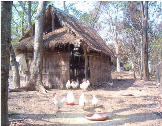
ຮູບ1: ຄອກໄກ່ຫຼັງຄາຫຍ້າຈິວ

ຫລັງຄາອາດມຸງດ້ວຍຫຍ້າຄາ, ສັງກະສິຫລື ຝ້າຫລັງຄາ ສູງຢ່າງນ້ອຍ 1,80 ແມັດ, ຜິ້ນຄອກຄວນເອົາຂີ້ແກບ ຂີ້ເລື່ອຍ ມາໃສ່ໃຫ້ໜາປະມານ 5 ຊັງຕີແມັດ ເພື່ອດູດຊີມນ້ຳຈາກຂີ້ໄກ່ເຮັດໃຫ້ຜິ້ນຄອກແຫ້ງສະອາດດີປ້ອງກັນພະຍາດ.