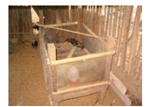
ຄອກອະນຸບານໄກ່ນ້ອຍ