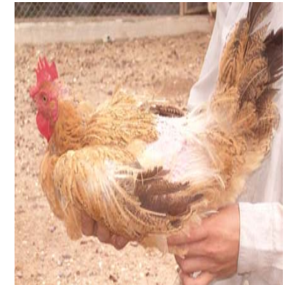
ໄກ່ໄຂ່ດີຂຶ້ນຂາດສ້ອຍ

ສຳລັບພໍ່ພັນ ປະສົມພັນເກັ່ງ,ຄວນປ່ຽນພໍ່ພັນທຸກໆ 2 ປີ ຫລືກເວັ້ນບໍ່ໃຫ້ພໍ່ປະສົມພັນກັບລູກມັນເອງ.