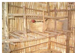
3. ຮັງໄຂ່(ໃຊ້ກະຕ່າຫລື ວັດສະດຸອື່ນໆ)