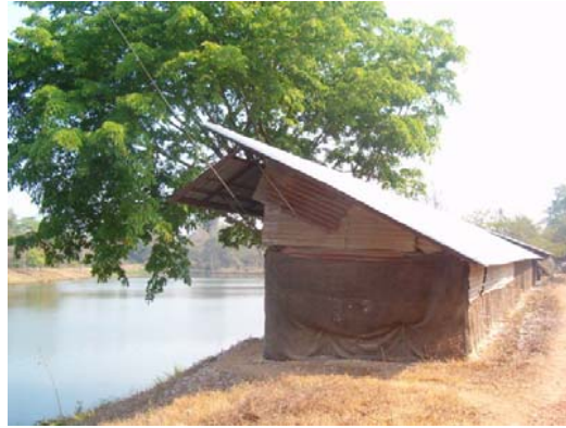
ຮູບ2: ເທີບໝາແໜງນຸນກ່າຍ