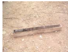
1. ຮາງອາຫານ