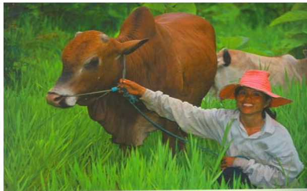
ຮູບ: ງົວລູກຊອດ ພັນບຣາມັນ